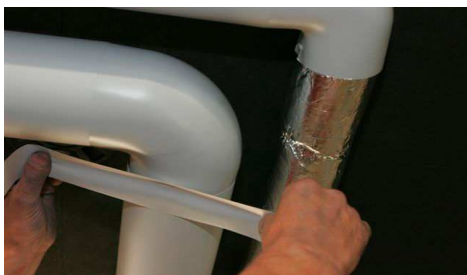
Vuugid kata PVC teibiga