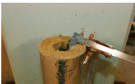
Mõõda isolatsiooni paksus