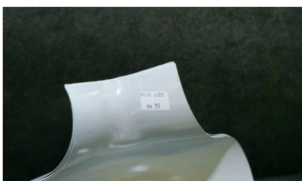
Vali nurk arvestades toru läbimõõtu ja isolatsiooni paksust