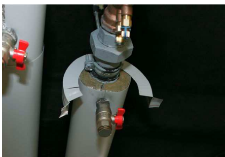
Isolatsiooni otsad kata AL mansetiga, arvestades isolatsiooni paksust