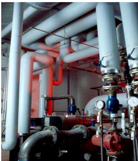
Teostatud tööde tulemus on ilusa väljanägemisega