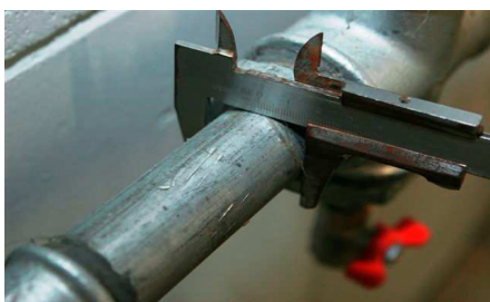
Mõõda toru läbimõõt